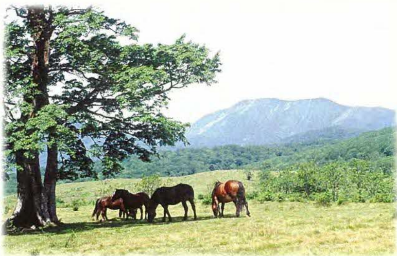
岩手県遠野市附馬牛町荒川高原牧場