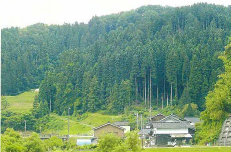
宮島杉のある風景