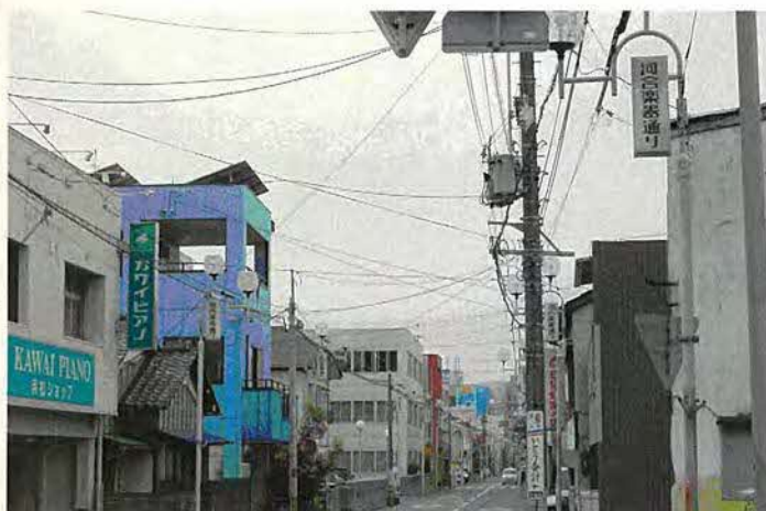
楽器店が並ぶ楽器通り