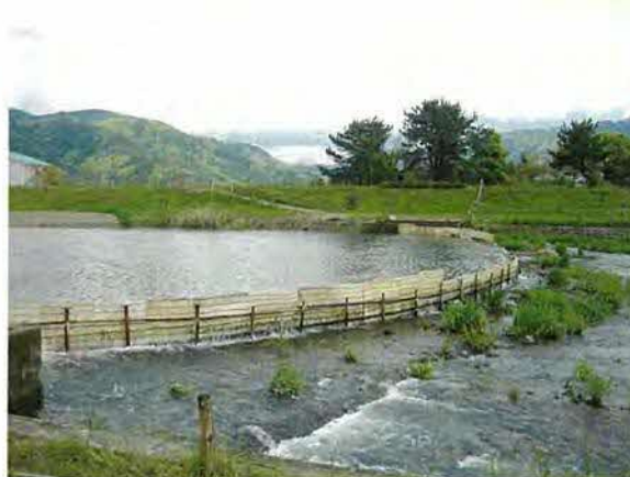
伝統的漁法「ヤナ漁」