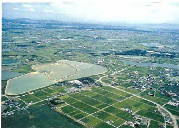
写真左寄りが加古大池で、築造当初から中堤を備えている。北西から撮影。

ため池は、所有者・管理者である地元の各土地改良区によって維持管理されています。また、土地改良区で構成される「いなみ野ため池ミュージアム運営協議会」では、ため池を親水空間とした多角的な利活用も図られています。しかし、農業・農村の衰退が今後も続くと、ため池の必要性は低下し、景観にも影響を及ぼすと考えられます。