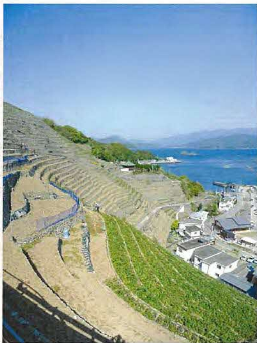
天と地と海のはざまに生きる 遊子水荷浦の風景

かつてを彷彿させる段々畑が、水荷浦にのみ残った最大の要因は、住民の方々の先祖への強い畏敬の念があったからに他なりません。それは平成12年度に結成された地元保存団体「段畑を守ろう会」に引き継がれ、4月には公式HPを立ち上げるまでに至りました。(http://www.danbata.jp) 行政においては、平成20年度から4か年かけて、国・県の支援を受けながら、0.8haの休耕地の復旧に取り組んでおり、2haまでに落ち込んでいた畑地は5haまで回復する予定です。また地元農協で水荷浦産ジャガイモのブランド化が図られるなど、産官民が一体となった地域活性化に広がっています。