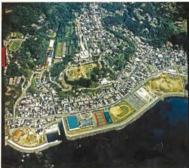
佐渡奉行所を中心に形成された町並み