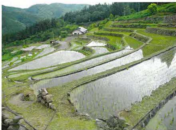
かんざい こ 神在居の千枚田