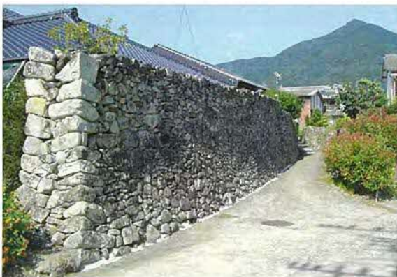
地勢と気象の影響を受けて作られた「防風石垣」 「コグリ」の集落景観