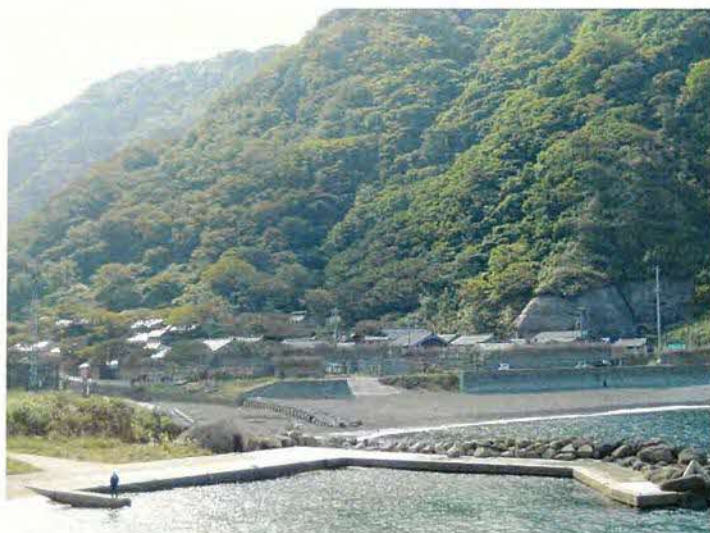
上大沢集落の遠望

間垣の荒廃地である棚田やニガタケ生育地を含め、重要文化的景観の選定を目指しています。