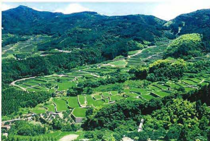
早苗の緑が眩しい蕨野の棚田

平成20年5月に「蕨野の棚田を守ろう会」が設立すると共に、平成22年3月にはNPOに認定され、景観法による景観整備機構等の制度を活用しつつ、営農活動のサポートや広報活動などを行っています。