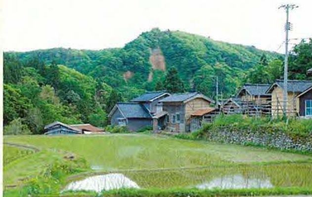
砂金採掘によって掘り崩された斜面と現在の集落が一体となった景観

今後は、両地区の重要文化的景観選定申出に向け、調査や保存計画の策定を進め、景観計画・景観条例と連携しながら、市内の文化的景観の保存を図っていきたいと考えています。