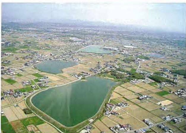
近代のため池が多い稲美町東部のため池群。手前は長法池。南西から撮影。