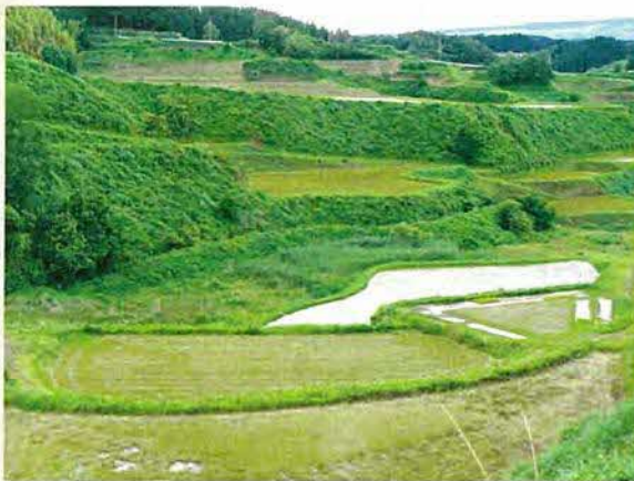
通潤用水下井手11号水路 改修前

山都町では、平成19年度より国庫補助を受けて保護推進事業を開始し、平成20年7月28日（第1次）、平成21年7月23日（第2次）、平成22年2月22日（第3次）に3度の選定を受け、現在台地のほぼ全域が重要文化的景観となっています。平成21年度においては、保護推進事業の端緒となった県農政部による通潤用水下井手水路の改修整備を文化庁事業で実施し、その一部が22年3月末に竣工しました（施工延長約240m）。棚田の利用と適切な水路管理によって生息する淡水魚アブラボテを中心とした水生生物相は、文化的景観を構成する貴重な要素であることから、自然と景観に配慮したコンクリートを用いない「近自然工法」で改修を行っています。同時に、管理の効率化を目的とした作業用道路を水路沿いに敷設する計画です。本年度においても、改修整備事業が継続中であり、詳細設計を経て平成23年3月の竣工を予定しています。