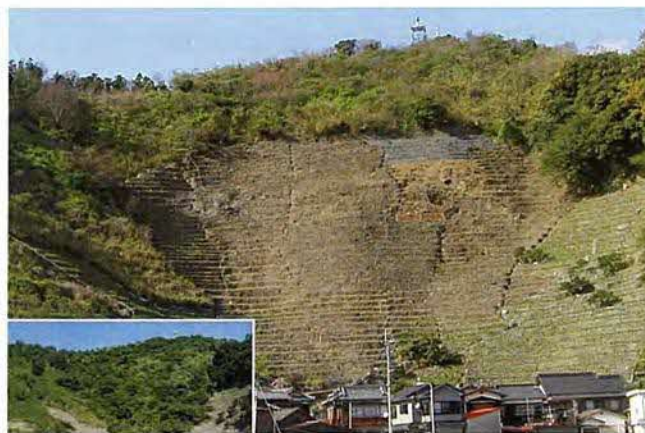
休耕地の復旧状況