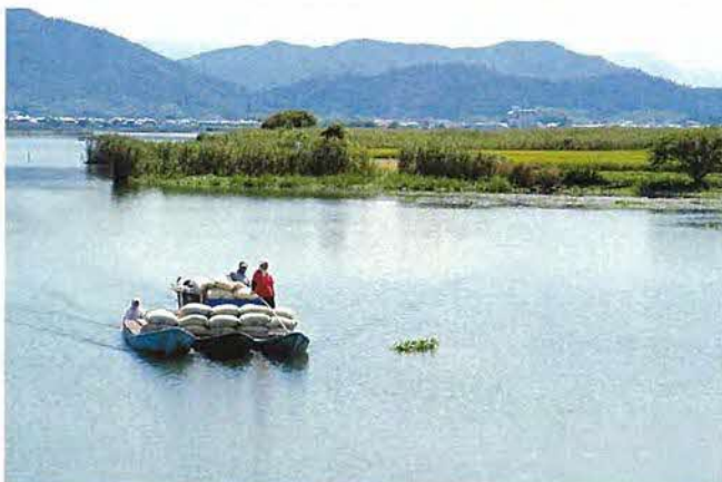
湖中の水田権座より「収穫」の風景