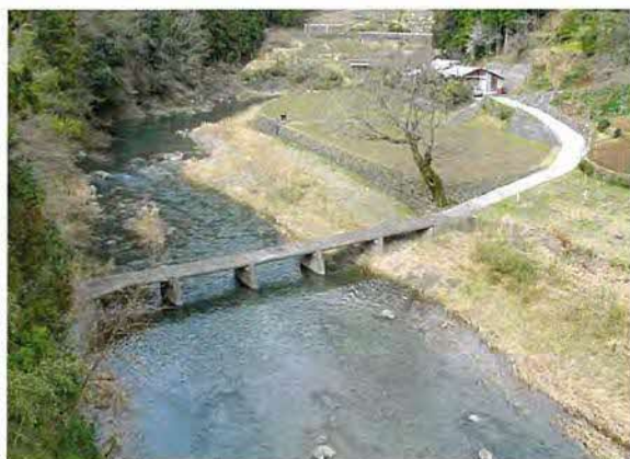
たけ やぶちん かばし 竹の藪沈下橋

梼原の歴史風土を育んできた、四万十川上流域の文化的景観の保全に務め、美しい国土と津野山文化を守り育て、歴史と文化の香り漂う町づくりを目指しています。