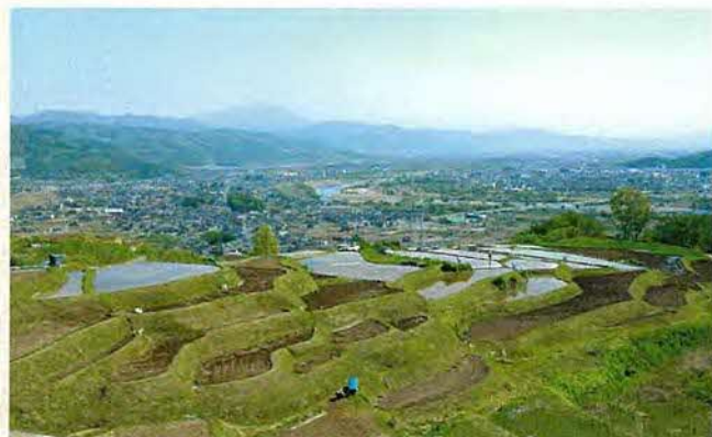
眼下に善光寺平が一望に望める

姨捨の棚田においても、約二割ほどの耕地が荒廃化しているのが現状です。狭く屈曲した区画、農道も用水路も田越しで行わなければならないなど耕作は、大変な状況です。さらに、急傾斜の大きな畦の除草作業は、危険な重労働となっています。こうした耕作条件や耕作者の高齢化も重なり、棚田景観の維持は大変な現状です。重要文化的景観に選定されたことを契機に、耕作者はじめ、地域住民・市民、行政、さらに広範なみなさん方のご支援・ご協力を得て、棚田での農業の継続ができる仕組みを早急に構築していくことが、「姨捨の棚田」での大きな課題です。