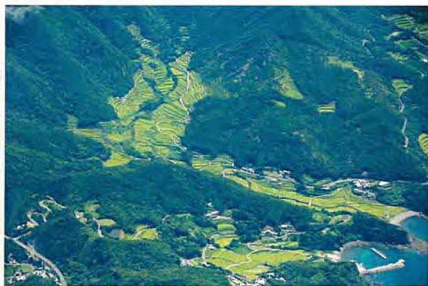
海から連続する棚田（春日町）

また、各種公共事業（道路整備など）や生産調整など、同じ行政間で異なる方向性の施策をどのように調整するかが課題であり、国や都道府県との調整もあるため、すぐに答えが出る問題ではありませんが、大きな視点と大きな枠組みで調整を図る必要があります。