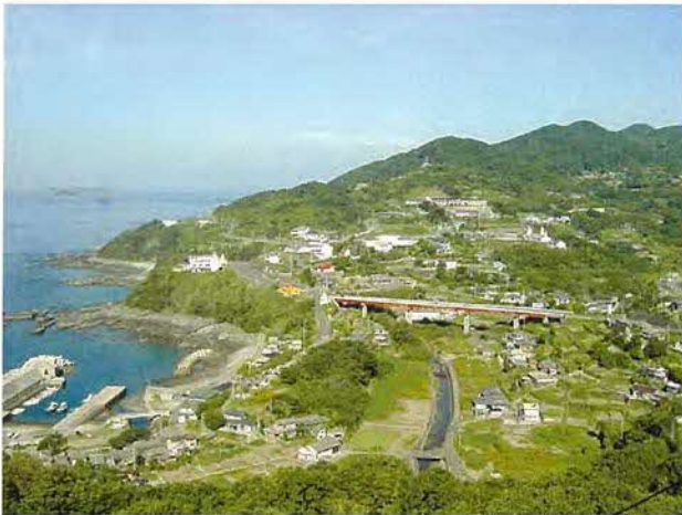
教会堂を中心とした集落景観

現在の取り組みとしては、宣教師がなぜここを選びこのような活動を行ったのかを検証するため、この地区が持つ歴史的背景を調査しています。また、近世末期と宣教師が活動した後の集落構造の比較や生業、生活環境の変化等を中心に、西洋人宣教師によって何がもたらされたのかを調査しています。