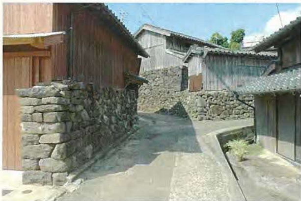
石壁を有する建造物（獅子町）