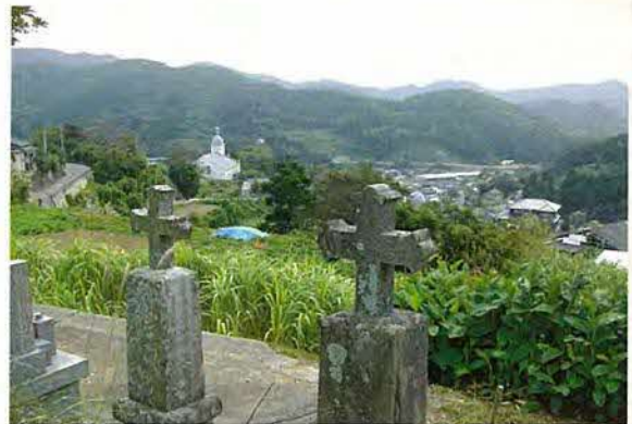
大江教会を中心にキリスト教の伝統的文化により形成されている農村景観