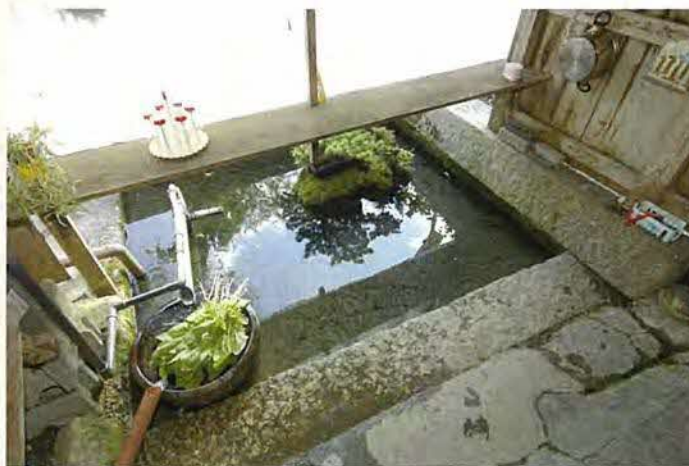
湧水を利用した「カバタ」

この地域では、住民自らが地域を守るために始められた、見学者の受け入れや案内ガイドを行う組織体制が確立され、また景観維持につながる環境保全型農業の取り組みも熱心に行われています。今後は、地域・行政・関係機関が連携しながら、これまで引き継がれてきた生活習慣を崩すことなく、だれもが「この地域に住みたい、住み続けたい」と実感することができるよう、住民の意向を十分に反映した形での保存、継承に努めていく必要があります。