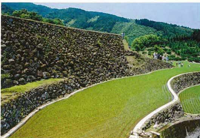
南川原の8.5mの高石垣