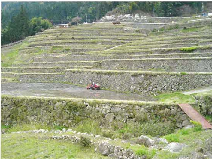
屋敷前の急傾斜地に展開する棚田