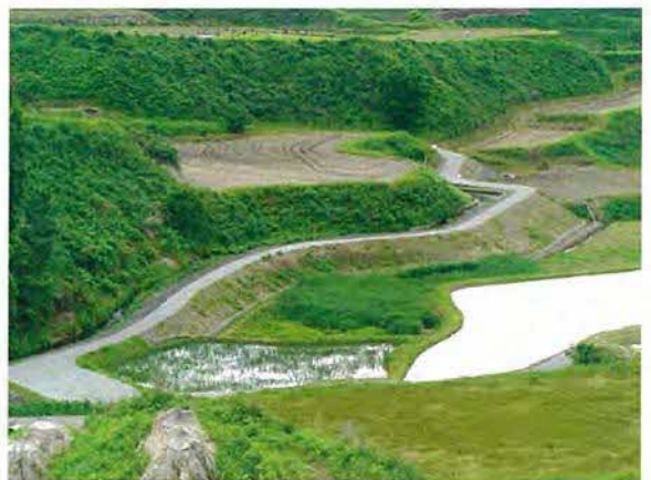
通潤用水下井手11号水路 改修後