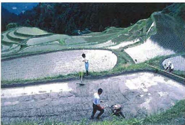
急勾配、小さな面積の棚田の田植え