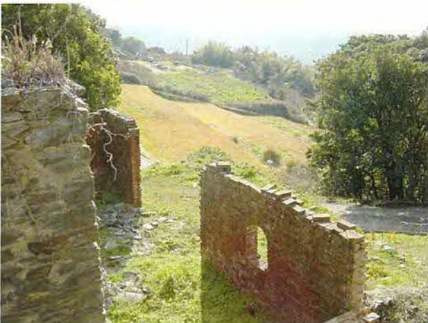
外国人宣教師がもたらした授産事業の痕跡