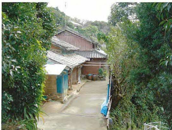
アコウの防風林に囲まれた屋敷