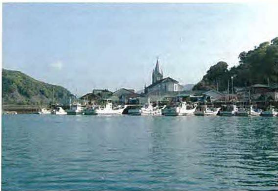
崎津教会を中心にキリスト教の伝統的文化により形成されている漁村景観

天草市は、崎津、大江、棚底の特色ある地域景観を保存するため、重要文化的景観の選定を目指しています。崎津は、崎津教会を中心とした穏やかな漁村景観がひろがります。沿岸には、海に突出した「カケ」と呼ばれる漁師の作業施設が点在します。また、密集した集落は、家屋と家屋の間に「トウヤ」と呼ばれる小路が海に向かって延びています。この地には400年程前にキリスト教が伝来し、江戸時代は潜伏キリシタンとして信仰が継続され、明治時代に復活し教会が建てられます。大江は、大江教会を中心とした段畑の続く農村景観がひろがります。丘陵に点在する農家は小さな里道で結ばれ、各家の近くには墓地があります。また、赤土の畑は、千枚岩と呼ばれる変成岩で段畑が開かれ甘藷や小麦が作付けされています。地区内には、江戸時代の潜伏キリシタンの伝承を伝える史跡が点在し、歴史の息づく農村景観を形成してします。棚底の集落は、冬に後背山の倉岳から吹く「倉岳おろし」から家屋を守るため、防風石垣を巡らせています。石垣の高さは2段〜3段程で、倉岳から長年に渡り土石流として扇状地に堆積した石が、畑、水田、宅地などの造成時に掘り起こされて利用された物です。また、扇状地には棚田が形成され、地下の伏流水を利用した「コグリ」と呼ばれる地下用水路が築かれています。棚底の集落は、地勢と気象が作り出した景観です。