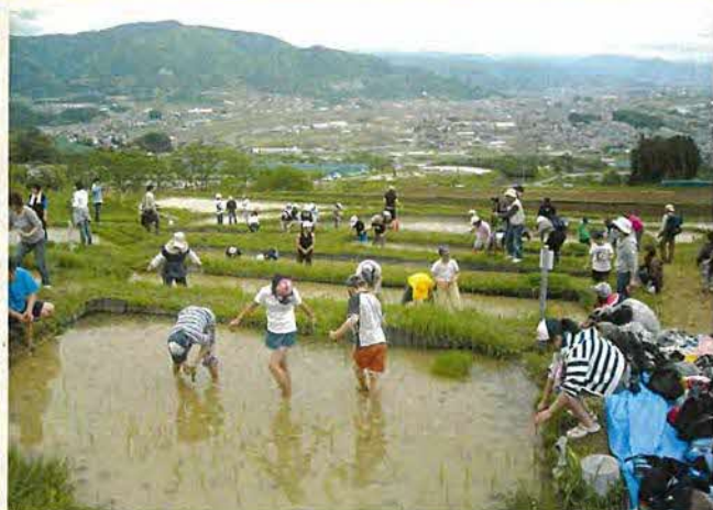
小学校の参加もある棚田オーナーの田植え