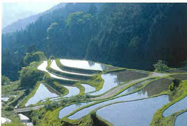
小さな棚田の1枚にも水がたたえられ、空と山の緑を写している。おだやかに田植えを待つ朝の風景。

現在では、過疎・高齢化、後継者不足の進展によって急速に耕作面積が減少しており、棚田景観の保全が大きな課題となっています。こうした現状に地元では、オーナー制による耕作継続や、ワーキングホリデイの活用による石積作業など、耕作継続の努力に加えて、里道、水車の復元等の景観整備や棚田ガイド養成のための棚田学び塾の開催など、棚田保全の取り組みを展開しています。