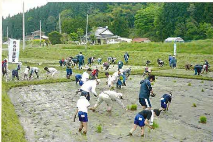
田植え体験と荘園遺跡巡りを組み合わせた「お田植え祭」(おだえまつり)は恒例となっています。

地元を中心に、この資産の保存と活用を意識したワークショップや各種イベント、少子高齢化を見据えつつ昔ながらの水利と微地形を尊重した景観農地整備や、グリーンツーリズム等の事業展開を行い、景観や歴史的な土地利用に配慮しつつガイダンス施設や駐車場等の整備を進めているところで、特に、食堂、物販、展示等からなるガイダンス施設は、今年から一部工事に入り平成24年のオープンを目指しています。この地域の整備については、整備指導委員会の提言により、伝統的農村を維持し営みを損なうことのないよう人工的な整備を極力排除し、自然な姿を残そうとしています。来訪者にとって、足元が悪く不便であることとなりますが、それが中世以来継承された荘園跡であることを理解していただき、時空を超え思いを馳せてもらえるよう村落環境の保存と整備を進めています。