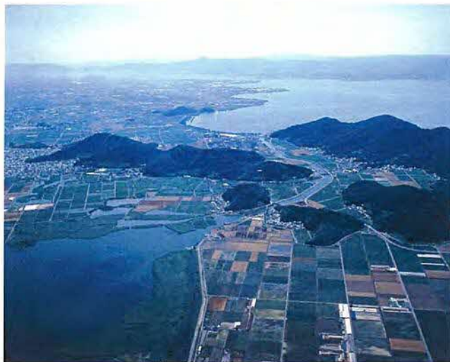
「近江八幡の水郷」全景東より

近江八幡市の北部に広がる水郷地帯は、広大なヨシ地と複雑に張り巡らされた水路、整然とした水田、これらの産業を支えた集落（白王・円山）と里山で景観を構成しています。特にヨシ地は約400年間続いているヨシ産業を支えた場で、文化的景観の重要な構成要素となっています。近江八幡のヨシは、陸ヨシと水ヨシに別けられます。陸ヨシは陸地で育ったヨシのことで、品質がよく、上等なヨシです。水ヨシは水面から出てくるヨシのことで、ヨシといえばみなさんこちらのヨシのことを創造されるでしょう。しかし、このヨシは風波の影響を受けやすく、あまり品質の良いものではありません。近江八幡のヨシはほとんどがこの陸ヨシで、品質は抜群に良いものばかりです。また、白王地区にある、湖中に残る水田（権座）では、今でも盛んに農業が行なわれており、酒米も栽培されています。白王地区では、グリーンツーリズムの受け入れ態勢も出来上がっており、住民指導で景観を守る会も結成され、地域住民以外のサポーターも増えてきております。平成22年3月に文化的景観地区に隣接する安土町と合併をしましたので、今年度より文化的景観地区の拡大に向けた調査を行なう予定にしています。