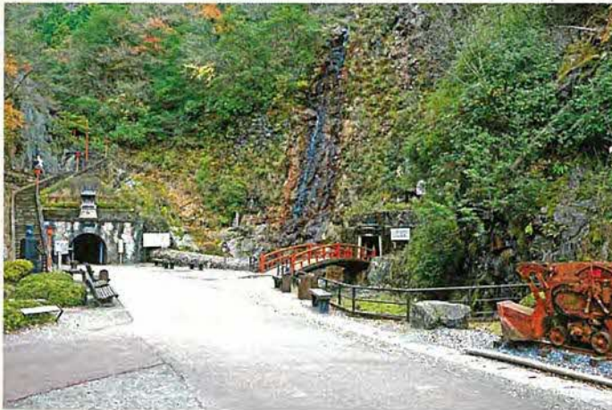
生野鉾山 金香瀬坑口と滝間歩

これまで、シンポジウムの開催や生野鉾山を中心とする「朝来市の近代化遺産調査報告書」及び記録映像DVD「生野鉾山」の発行、パンフレットの作成・配布や説明会などの活動を進めており、平成22年度には文化的景観保存計画を策定する予定です。さらに、景観行政団体となり景観計画の策定など関連事業を推進し、重要文化的景観の選定を受けることとしています。