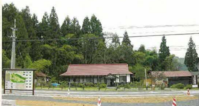
平成21年7月に空き家だった重要建物を修復した休憩所「古曲田家」がオープンし、地元の女性たちが交代で対応しています。昼食は予約を受け提供しています。