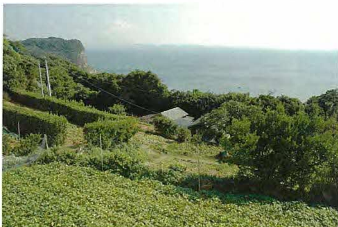
海から内陸に向かう伝統的な土地利用

平成20年度から本格的な調査を行っており、現在は調査を一部継続しながら保存計画の策定を行っています。土地の管理や後継者問題などの課題を解決するための体制構築が急務であり、地元住民と連携を図りながらの体制構築を目指しています。